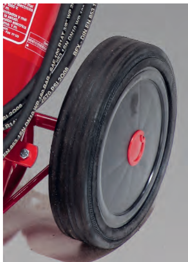
Breite, stabile Räder. Hohe Mobilität.