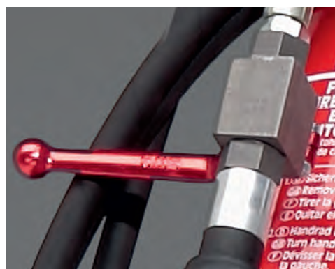
Löschmittelstrahl durch Ventilhebel abstellbar