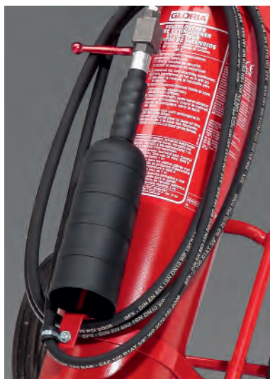
Leicht bedienbare Löscheinheit