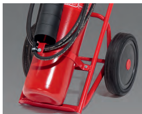
Stabile Fahrgestelle, Rahmen demontierbar